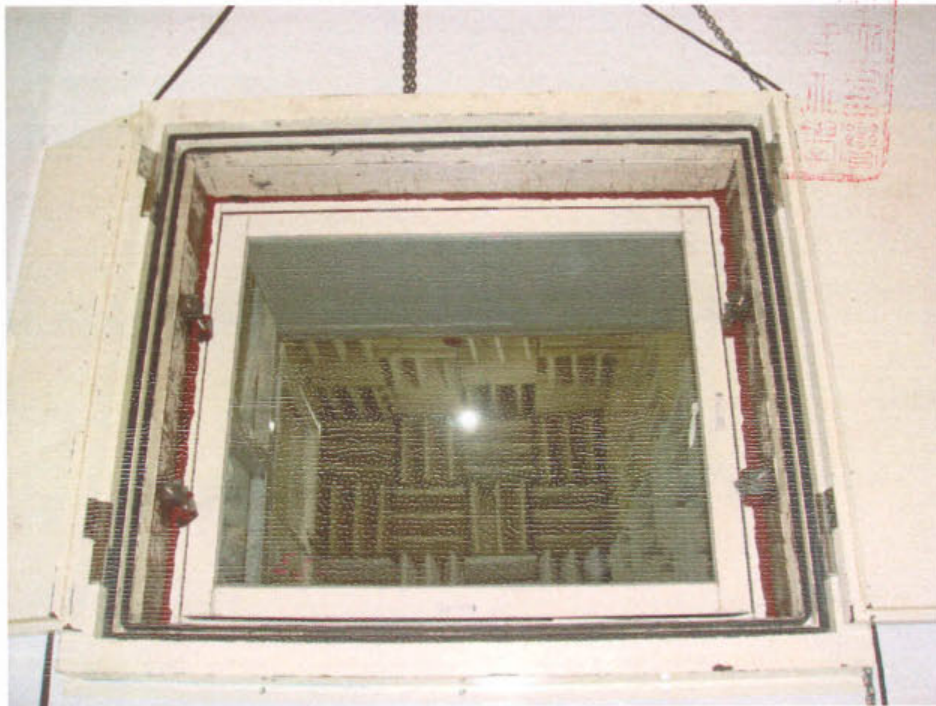
圖 2 試樣佈置圖 (迴響室)