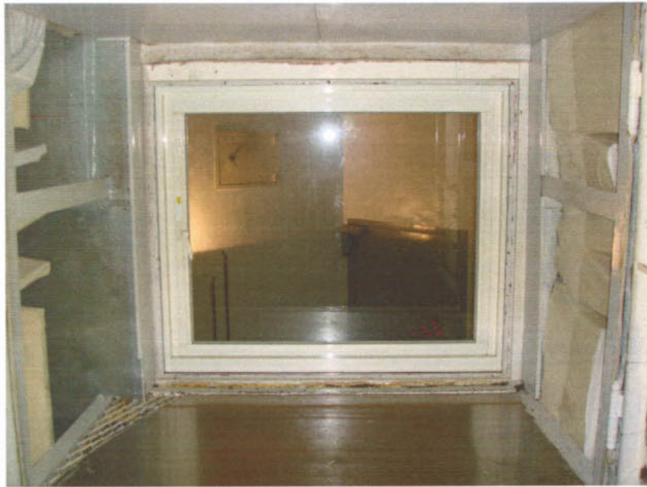
圖 1 試樣佈置圖 (無響室)